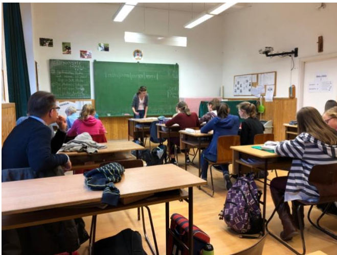
Kuva 12. Musiikin teorian opetuksessa havaittiin iso ero. Tätä treaantaan Unkarissa jo 1. luokasta alkane ja lukioon tultaessa taitavuus on jo niin suurta, että opiskelijamme kokivat, että tässä peruskoulun 5. luokkalaisille annettava opetus on vaativampaa kuin musiikkilukion stt-alkukurssien taso. Kannattiko Savonlinnassa lakkauttaa musiikkiluokkien toiminta. Historia lienee osoittanut aika selvästi, mitkä kulttuuri pärjäävät aikojen saatossa, peleihin vaiko kulttuurin keskittyvät. Rehtori kysyi onhan Teillä tällainen jatkumo perusopetuksesta, olin ihan hiljaa siinä kohden. Kuva Reima Härkönen,

Vierailun jälkeen suunnitellut isäntien toteuttamaksi aikomat aktiviteetit peruuntuivat paikallisen juhlahetken vuoksi, opiskelijat saivat omaa aikaa ja rehtori kävi 12 kilsan juoksulenkillä, kotoisaksi olon teki se, että italialainen matkaseurue kysyi “ulos pääsyä” Margit-saarelta, luulivat paikalliseksi, en mene varmuuteen ohjeiden osuuvuudesta, kuten todettua, tunsimme olomme kotoisaksi.