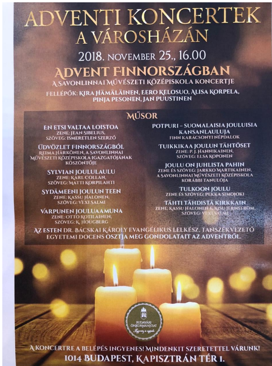
Kuva 5. Esiintymisjulistte, jota oli laajalti jaossa Budavárisissa ja mm. Suomen.Unkarin suurlähetystön sivuilla.

Konsertin harjoittelu Budavárin kaupungintalolla, klo 10 -12 ja 13:30-15:40, välissä isäntien tarjoama lounas, äänestettiin äänin 6-0, että syötiin liikaa.