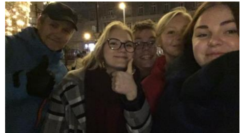
Kuva 4 Tässä kuva tutustumisesta, mutta se vaihtui hieman pidempään tutustumiseen paikalliseen joulumarkkinaan. Kuva joku heistä

Opiskelijoiden ohjelmaan kuulunut tutustuminen Tiedepuistoon