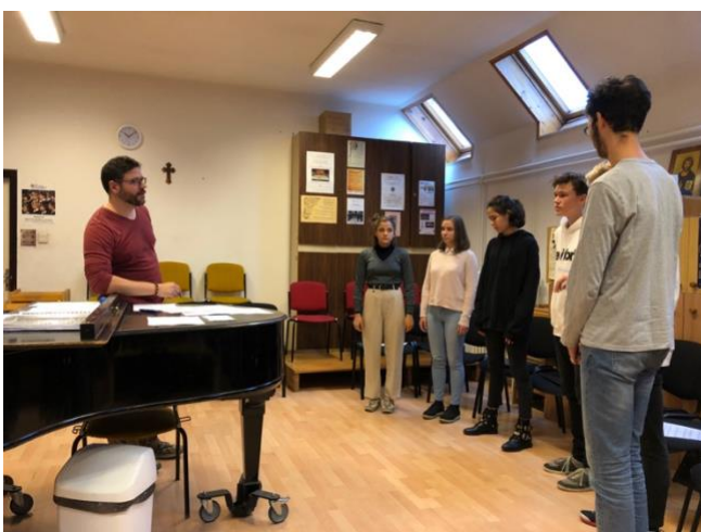
Kuva 10. Kuoron / yhtyelaulun harjoittelua, opiskelijoidemme mukaan useiden stemmojen mukanaolo teki harjoituksesta hyvin vaikean Ope oli vaativa, mutta opetus taohtui hyvin yställisessä ja kannustavssa ilmapiirissä.