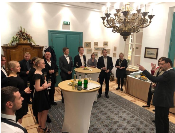
Kuva 9. Tapaaminen pormestari Gabor Nágyn edustustiloissa. Tässä sunnitellaan lahjoitetun taulun sijoituspaikkaa.

Isäntien tarjoama illallinen Mayor's lounge –tilassa.