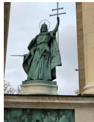
Kuva 1. Pyhä Tapani Sankareiden puiston kuvapatsaasta kuvattuna.

Unkarin valtiollisia vaiheista mainittakoon se, että se jäi 1526 turkkilaisvallan alle. Silloinen Unkari jakaantui kolmeen osaan, Habsburgien hallinnoimaan länsiosaan, Transilvanian autonomiseen kuningaskuntaan ja suoraan turkkilaisten alaisuudessa olleeseen alueeseen. Länsivallat hätistivät turkkilaiset