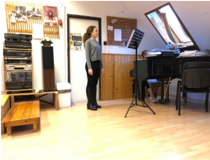
Kuva 11. Äänenmuodustuksen harjoittelua. Tätä on tarjolla kaikille n. 300 opiskelijalle. Tämä opiskelija on lisäksi laulun opiskelija ja siksi saa muuatkkin harjoitusta viikoittain. Opena koulun varareksi.